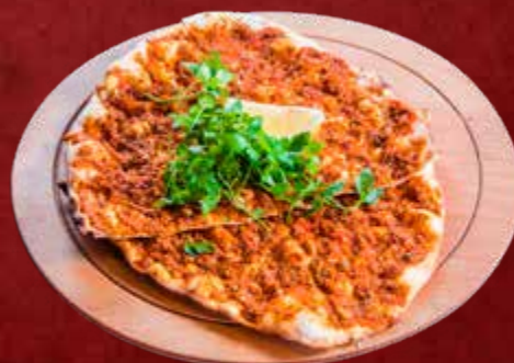
60. Antep Lahmacun