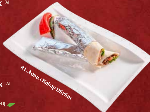
81. Adana Kebap Dürüm