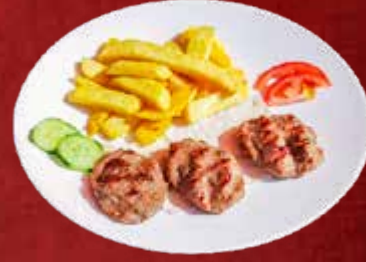
159. Izgara Köfte