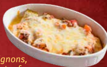
132. Kuzu Güveç