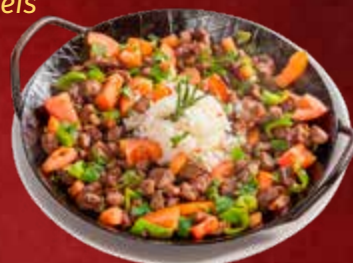
130. Sac Kavrma