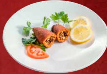
42. İçli Köfte