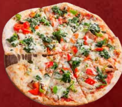
146. Pizza Vegetarisch