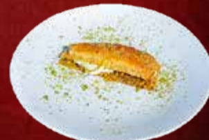
174. Antep Baklava