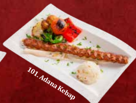
101. Adana Kebap