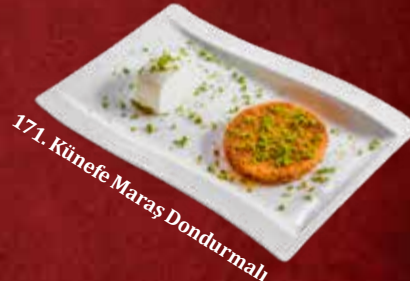
171. Künefe Maraş Dondurmalı