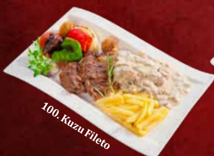
100. Kuzu Fileto