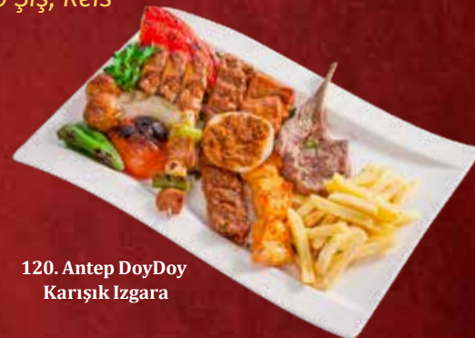
120. Antep DoyDoy Karışık Izgara