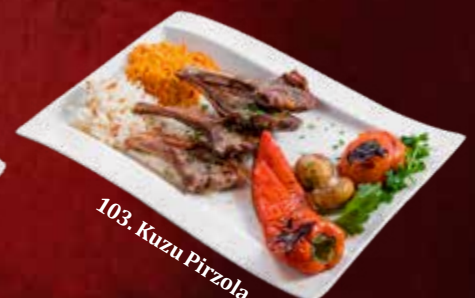
103. Kuzu Pirzola